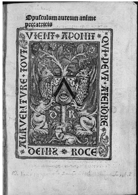
Рис. 4. Opusculum aureum anime peccatricis. [Paris, c. 1503] (НИОРК 583 инк). Титульный лист