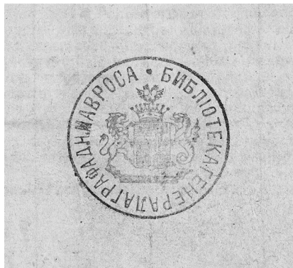
Рис. 1. Суперэкслибрис графа Дмитрия Николаевича Мавроса (1820—1896) на корешке конволюта НИОРК 583 инк, 584 инк, 815 инк