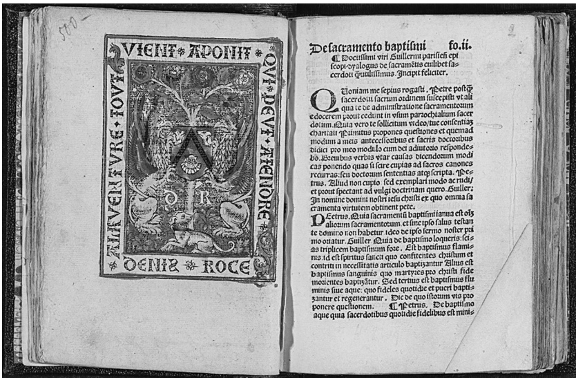
Рис. 3. Opusculum aureum anime peccatricis. [Paris, с. 1503] (НИОРК 583 инк). Л. 28 об. Издательская марка Дени Роса. Guillelmus de Parisiis. Dialogus de septem sacramentis. [Paris, с. 1495–1498] (НИОРК 584 инк). Л. 2

** В ВМС описано другое издание «Зеркала грешной души».