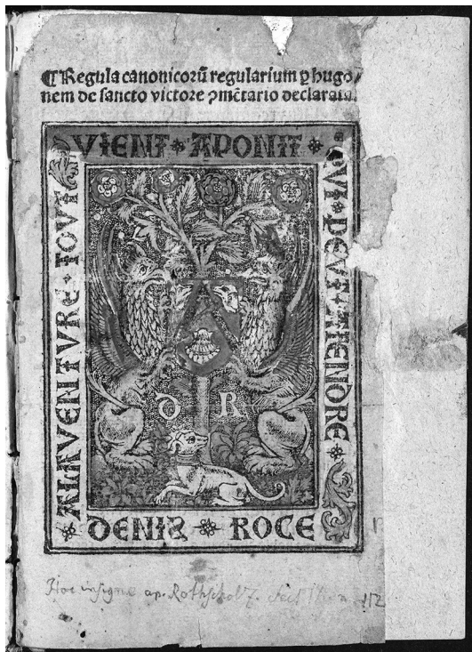
Рис. 6. Hugo de Sancto Victore. Regula canonicorum regularium per Hugonem de Sancto Victore commentario declarata. [Paris, c. 1503] (НИОРК 815 инк). Титульный лист

разные наборы экземпляров: в GW это экземпляры библиотеки Линкольнского собора, Баварской библиотеки и БАН, а у Моро – Французской национальной библиотеки, Библиотеки Йельского университета и Российской государственной библиотеки.