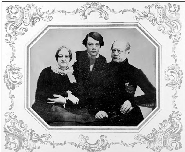
Илл. 3. Ателье И. Пейшеса (?).