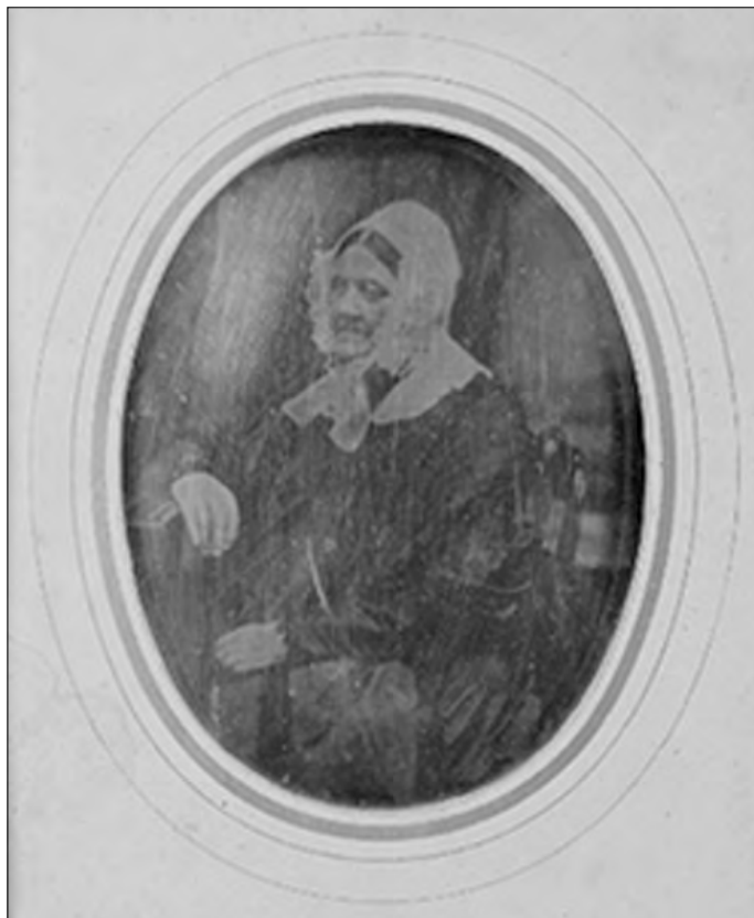
Илл. 1. Йозеф Венингер. Портрет неизвестной (Т.Л. Миллер ?). Санкт-Петербург, 1845–1857 гг.

Архив СПбИИ РАН. Русская секция. Ф. 121 (А. А. Сиверс). Оп. 1. Д. 213. 16,8 × 13,3 см (в паспорту); 9,8 × 7,5 см (овал в свету)