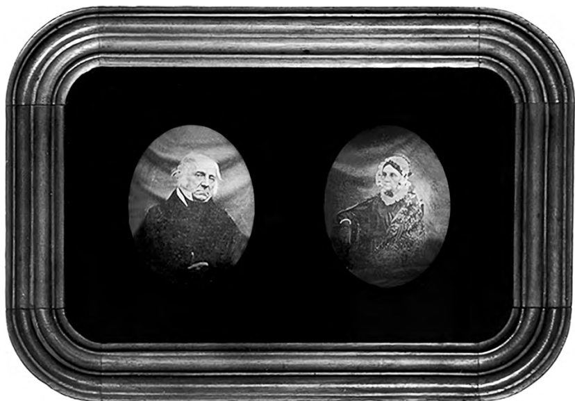
Илл. 4. Ателье Г. Венингера (?).

Парный портрет И.Н. Тютчева и Е.Л. Тютчевой. Москва, 1844–1845 гг.