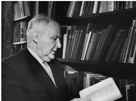
Дома у книжных полок. 1959 г.